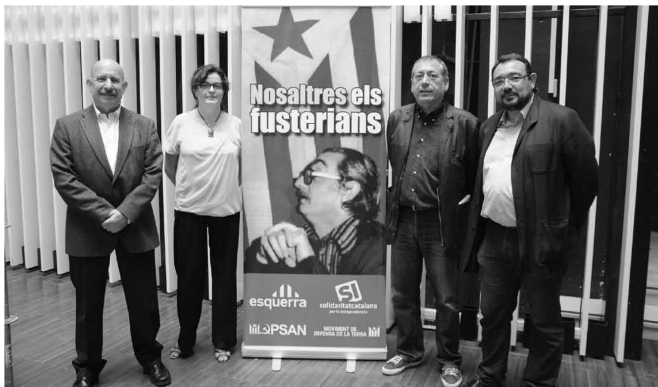
Els quatre ponents de la campanya "Nosaltres, els fusterians" abans de l'acte de presentació.

En el 50è aniversari de Nosaltres, els valencians i el 20è de la mort del seu autor, les organitzacions independentistes han endegat, al País Valencià, una campanya d'actes que, amb el lema "Nosaltres, els fusterians", vol ser un primer pas vers un projecte d'unitat política per la independència. LLUITA ha donat la paraula als impulsors de la iniciativa.