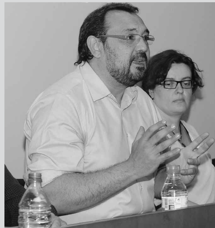
El president d'ERP, a l'acte de presentació de la campanya “Nosaltres, els fusterians”.

El llegat de l'obra de Joan Fuster no és –com alguns voldrien– matèria d'estudi i d'arxiu, sinó, sobretot, una invitació al redreçament del país. L'autor convida els i les independentistes a assumir el repte.