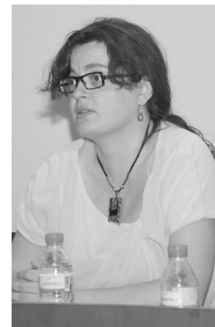
La coordinadora de SI al País Valencià s'adreça al públic.

Potser eixe siga l'altre repte dels qui avui reivindicuem la unitat de la gent fusteriana, que hi haja qui considere que no som prou "istes", prou feministes, prou ecologistes, prou marxistes..., sense voler adonar-se que en aquests moment la